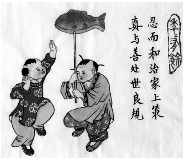
对联：真与善处世良规，忍而和治家上策 横批：年年有余