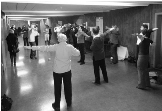
左图：三天的博览会期间，一批批的人们不间断地来学炼法轮功 右图：人们纷纷来到展位前了解法轮大法