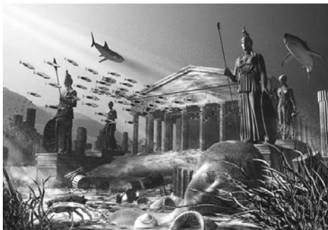
图：大西洲的故事，也是历史上惨痛教训的一页。图为艺术家绘制的大西洲（亚特兰蒂斯）海底遗迹。