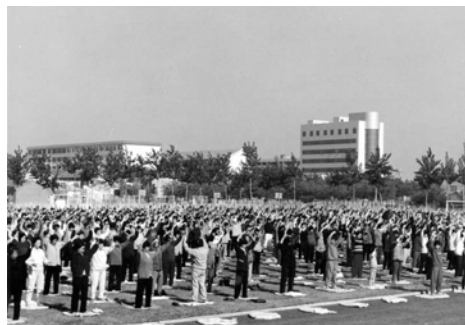
历史图片：1998年秋，山东潍坊市奎文区2000多人在白浪河畔的体育场炼法轮功。

第一遍《转法轮》我学了整整半个月，随着一天天看《转法轮》，我的腿一天天在消肿，看完后也没那么痛了，我慢慢试着下地，哎，竟然能走了！我马上打电话请他同事来教我炼功。一个月后，腿基本恢复正常，我便去上班，领导和同事们都很惊讶：“你不是半月板坏了得做手术吗？怎么治的？怎么这么快就能上班了？”“学《转法轮》、炼法轮功