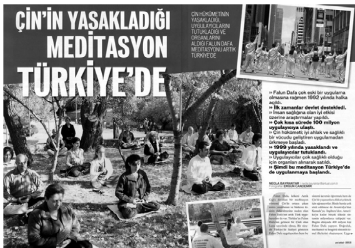
图：土耳其著名杂志《新当代》介绍法轮功以及中共对法轮功的残酷迫害