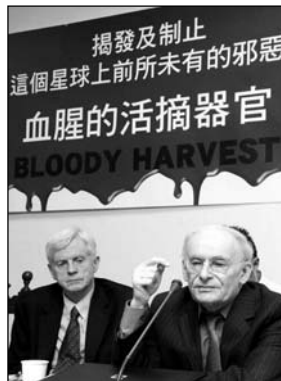
图：六月二十八日，大卫·麦塔斯和大卫·乔高在发布会上。