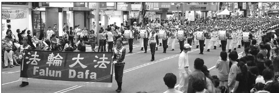
图：二百人组成的台湾天国乐团应邀在“世界管乐年会”系列活动中演出

因揭露中共活摘器官人权暴行而获得二零一零年诺贝尔和平奖提名的大卫·乔高与大卫·麦塔斯在台停留期间，巡回各地举办研讨会，引发台湾各界对中共活摘器官暴行的高度关切与广泛讨论。◇