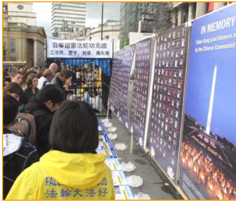
图：2011 年 7 月 16 日，英国伦敦鸽子广场，人们被法轮功真相吸引。

亲身受益的法轮功学员自然希望更多的人也能象他们一样受益。他们在修炼前，面临的困扰其实也是现代社会的人们普遍面对的问题。金钱买不来健康，地位也带不来幸福感和安全感，相反，一味追求金钱和地位，一味的追求物质和感官上的满足，却