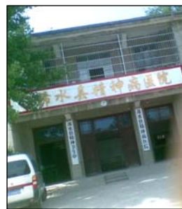
图:浠水县精神病院 左图:酷刑演示:打毒针(注射不明药物)

中共江氏集团采用流氓手段疯狂迫害法轮功以后,我三次被投入县精神病院。第一次,医生用镇静剂把我催眠,然后给我打点滴,使我昏死过去几天。醒来后又将我绑在床上,用电针电我,问我还炼不炼,我说炼,就不停地电我。第二次是 2002 年 10 月 26 日,检察院、政保科、610 以“十六大要召开”为由,将我从劳教所强行抬入县精神病院,绑在病床上,注