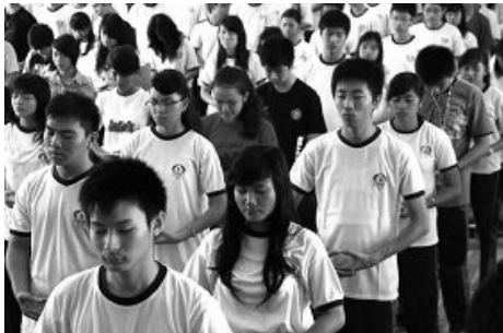
图：天主教高中的学生正在学习法轮功

来自捷克的艾诺曼先生签名支持 232 号决议案并告诉记者，他能理解法轮功学员在共产国家遭受迫害的情形，因为二十五年前他也从当时共产铁幕统治下的捷克逃离，明白共产专制是怎么回事。他指出：“被挤压的人民对共产主义都很厌恶”。◇