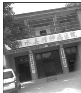
图:浠水县精神病院 左图:酷刑演示:打毒针(注射不明药物)

中共江氏集团采用流氓手段疯狂迫害法轮功以后,我三次被投入县精神病院。第一次,医生用镇静剂把我催眠,然后给我打点滴,使我昏死过去几天。醒来后又将我绑在床上,用电针电我,问我还炼不炼,我说炼,就不停地电我。第二次是 2002 年 10 月 26 日,检察院、政保科、610 以“十六大要召开”为由,将我从劳教所强行抬入县精神病院,绑在病床上,注