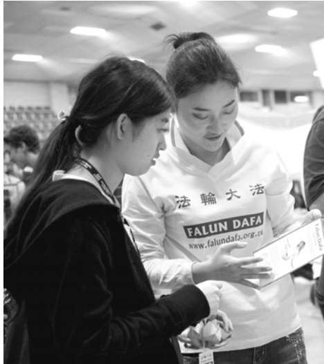
图：法轮大法俱乐部成员在迎新活动中讲真相