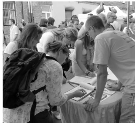
图：波兰民众纷纷签名反对中共迫害

越来越多了解真相的波兰人来到征签台排队签名，表达他们对中共邪恶行为的愤慨和反对。一位姑娘看到中国大陆法轮功学员遭受残酷迫害的照片，无法忍受，站在展板前失声痛哭。很多人都在询问“我还能帮助你