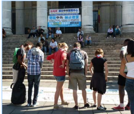
人们在观看揭露迫害的展板

很多中国大陆的游客也索取资料。他们有的来自河南、四川、东北和北京。他们了解到，法轮功的“真善忍”已经传播到一百多个国家和地区，受到各国人民的欢迎和尊敬。◇