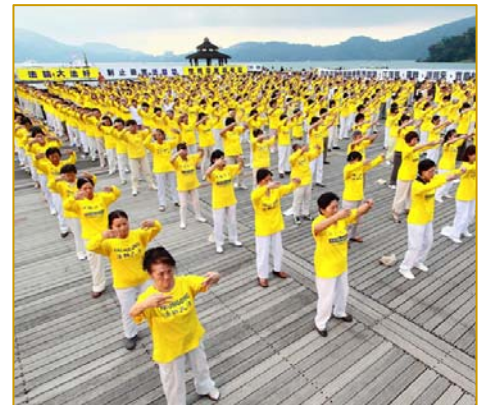
为制止迫害 台湾法轮功学员在日月潭畔集体炼功、讲真相

这样的例子在台湾数不胜数，在世界各地都屡见不鲜，由此可见，中共野蛮的迫害和诽谤，根本无法阻挡法轮功在全世界的弘扬，迄今十二年来，法轮功传遍世界一百多个国家和地区，受到不同族裔各阶层民众的喜爱，法轮功的主要著作《转法轮》被译成三十多种文字在全世界发行。中共的残酷迫害并没有打倒法轮功学员，法轮功更在反迫害中屹立不摇，并蓬勃发展。◇