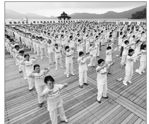
为制止迫害 台湾法轮功学员在日月潭畔集体炼功、讲真相

这样的例子在台湾数不胜数，在世界各地都屡见不鲜，由此可见，中共野蛮的迫害和诽谤，根本无法阻挡法轮功在全世界的弘扬，迄今十二年来，法轮功传遍世界一百多个国家和地区，受到不同族裔各阶层民众的喜爱，法轮功的主要著作《转法轮》被译成三十多种文字在全世界发行。中共的残酷迫害并没有打倒法轮功学员，法轮功更在反迫害中屹立不摇，并蓬勃发展。◇