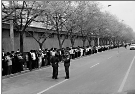
秩序井然的“四二五”上访民众

然而江泽民集团为迫害法轮功，蓄意把“四二五”和平理性的依法上访歪曲成“围攻中南海”，在国内外大肆诬陷宣传，混淆视听迷惑民众。但是由于共产党的专政历来被国际