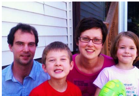
图：拥有幸福家庭的凯（右二）经常以自己的亲身经历讲述法轮功真相

凯以前患严重的背痛和颈痛，不得不辞去工作，四处就医。尝试了各种医疗方法，付出了昂贵的医疗费，仍不见效。走投无路之际，一九九八年八月，她遇到了法轮功，生命从此开始了阳光普照。在二零一一年五月十三日“世界法轮大法日”的纽约庆