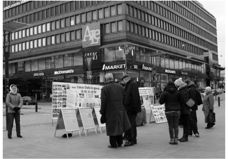
图：赫尔辛基市中心，人们在认真了解法轮功真相

一群中国学生路过，看到横幅上的图片有点吃惊。学员给他们讲天安门自焚伪案真相，那是中共一手导演来栽赃陷害法轮功的丑剧。学员们还告诉他们十二年来种种迫害的残酷，中国学生们纷纷接过真相资料，表示愿意了解。◇