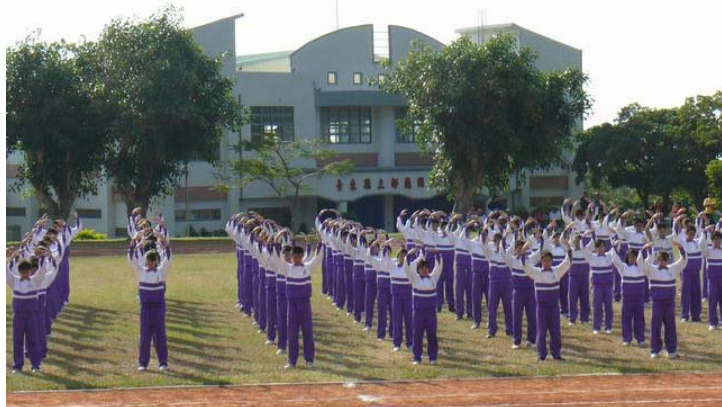
图：二零零九年十二月十一日，台湾台东县都兰国中校庆运动会开幕典礼上全校一百多位学生表演了法轮功五套功法，动作整齐、优美，让家长和来宾十分赞叹。