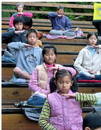
二零零九年台北明慧夏令营参与者午餐后炼法轮功第五套功法

两个月过去了，他身上的恶根似乎很难去除，很容易故态复萌，但变化还是在一点点发生着。除了请老师外，我时常睡前给他讲生活、讲历史故事，讲法轮大法的