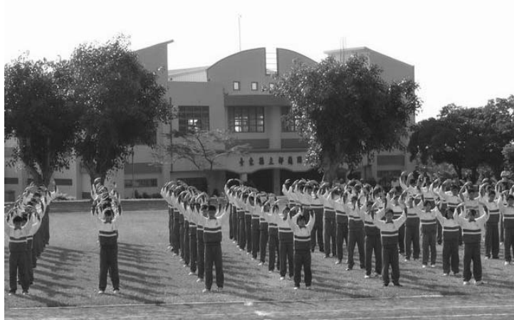
图：二零零九年十二月十一日，台湾台东县都兰国中校庆运动会开幕典礼上全校一百多位学生表演了法轮功五套功法，动作整齐、优美，让家长和来宾十分赞叹。