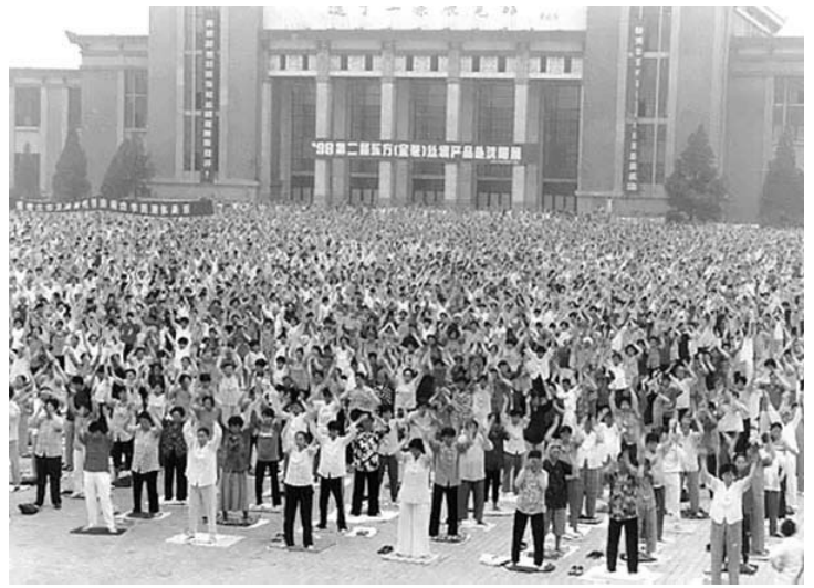
图：1998 年 5 月沈阳万人集体大炼功场景

法轮大法自 1992 年 5 月公开向社会传出以来，短短的七年时间里，在全世界吸引了上亿有志有识之士。大法修炼不求名、不求利，强调用“真善忍”的法理约束自己。无论男女老幼，无论来自哪个国家、民族，只要坚持修心炼功者无不深深受益。在 1993 年北京东方健康博览会上（左图），法轮功创始人李洪志先生获博览会最高奖“边缘科学进步奖”，和大会的“特别金奖”，以及“受群众欢迎气功师”称号，是该届博览会上荣获奖励最多的气功师。如今法轮大法已收到来自世界各国的褒奖、支持议案和信函超过 3200 项。◇