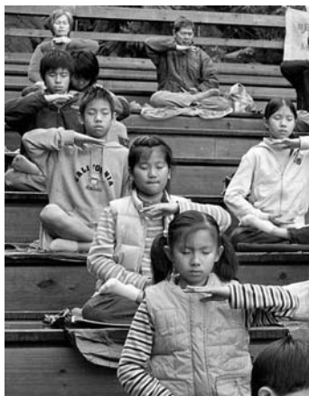
二零零九年台北明慧夏令营参与者午餐后炼法轮功第五套功法

两个月过去了，他身上的恶根似乎很难去除，很容易故态复萌，但变化还是在一点点发生着。除了请老师外，我时常睡前给他讲生活、讲历史故事，讲法轮大法的