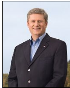
图：加拿大总理 斯蒂文·哈珀

加拿大总理、政府多次公开提出法轮功和人权问题。三月五日在日内瓦召开的联合国人权会议上，加拿大谴责世界各地发生的针对宗教团体骇人听闻的恶劣行为。在这些团体中，加外长提到了法轮功修炼者。◇