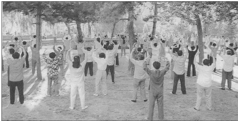
历史图片：1996 年长春法轮功学员集体晨炼法轮功