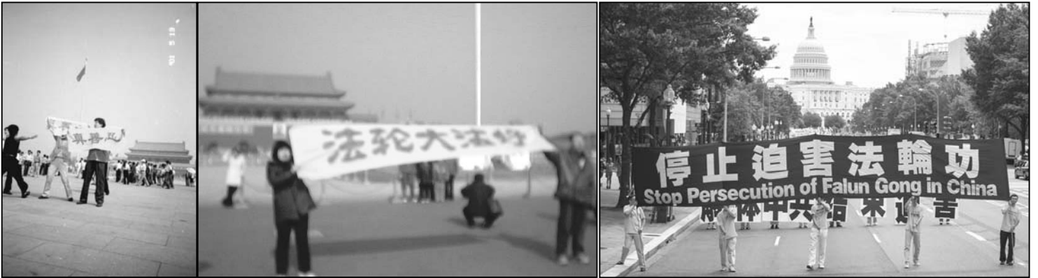
左图：法轮功学员在天安门广场展示横幅和平请愿；右图：二零一二年七月十三日，来自欧、美、亚、澳等地的三千多名法轮功学员汇集美国首都华盛顿 DC 举行游行集会，抗议中共迄今长达十三年的惨无人道的迫害。

【明慧网】一九九九年七月二十日中共江氏集团动用整部国家机器迫害法轮功，动用一切媒体、司法、军警、特务、党政、外交，进行全方位的迫害，对法轮功学员非法关押、洗脑、毒打、电刑、性侵害、强行注射破坏中枢神经药物，乃至活摘器官，惨无人道的迫害手段令人发指。迄今至少有三千五百名法轮功学员被迫害致死的案例被证实，难以计数的无辜公民被绑架进看守所、劳教所、监狱、洗脑班与精神病院，被迫害致伤残、失学、失业、流离失所、家破人亡。