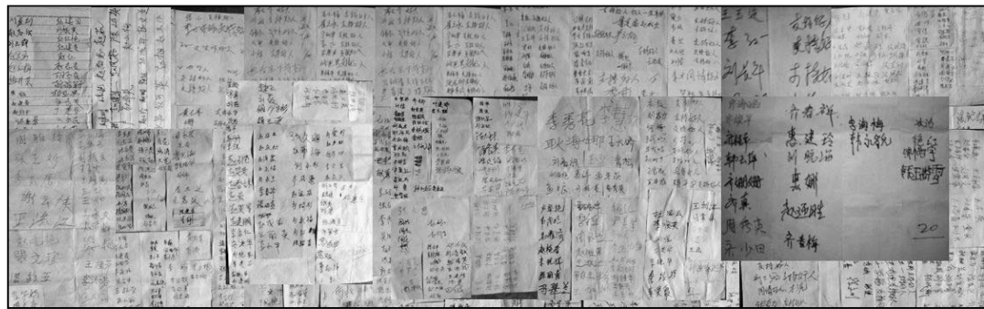
图：唐山、秦皇岛支持营救郑祥星的更多民众签名，人数 1201 人。