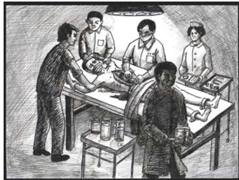
中共活体摘取法轮功学员器官谋取暴利模拟图

2012年7月在加拿大出版的《国有器官》（State Organs: Transplant Abuse in China）一书中，多位世界医学界权威和专家探讨了中共动用国家机器介入器官移植的现象。其中被誉为全球科技界最有影响力的十大人物之一、美国宾夕法尼亚大学生物伦理学中心主任亚瑟·卡普兰在书中提到：中国大陆活摘器官“为需求而杀人”的现象普遍存在。书中收录了多位在国际器官移植领域的著名人士和权威医生的文章。这些文章从