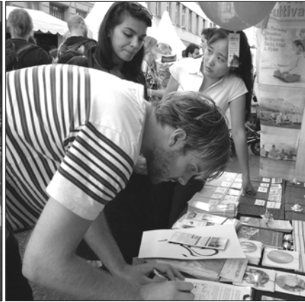
左：丹麦法轮功学员参加游行，微笑着向沿途民众展示“法轮大法好！” 右：许多民众与法轮功学员交谈、了解真相后，纷纷签名支持法轮功。