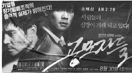
上：揭露中共活摘器官的韩国电影《同谋者们》海报。