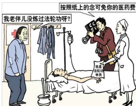
▲收买病人,利用病人的贪利、急切之心,制造伪证来陷害法轮功。

每早例会,各报主编、各部主任要听明白两点:一个是不准报道的真新闻;一个是必须报的假新闻。记忆中,有一阵电视里天天“法轮功”,播音员无论男女,表情严厉,