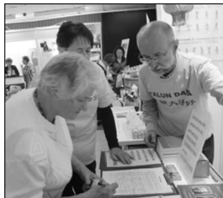
图：法轮功学员做专题报告，并展示功法。右图：波兰民众签名谴责中共迫害