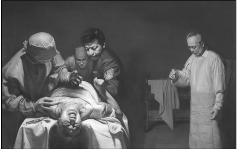
《活摘器官的罪恶》，董锡强，油画，54×54 英寸，2007 年。