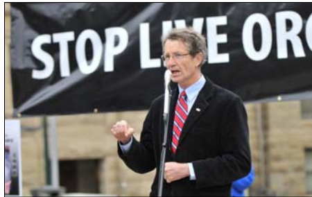
图：亚省省议员大卫·斯旺博士发言

亚省省议员，前自由党领袖大卫·斯旺博士在集会上呼吁加拿大政府对中共迫害法轮功修炼者事件进行调查，必须制止这一长期的迫害。“与一个无论是制度、劳工、环境以及人权等等方面都不同的国家交易，