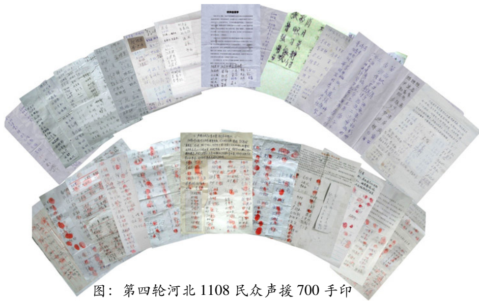
图：第四轮河北 1108 民众声援 700 手印

露了中共邪恶的本质,失尽民心。截至目前,又有 1108 名(其中 622 人按上了自己的手印)知情世人站出来声援法轮功,抵制中共的疯狂迫害。