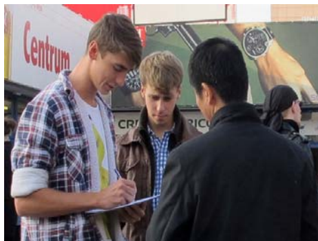
图：波兰各界人士踊跃签名

【明慧网】二零一二年十月十二日至二十三日，波兰法轮功学员在华沙市中心地铁广场揭露中共对法轮功十三年来的残酷迫害，特别是中共活摘器官、并将尸体加工贩卖牟利的滔天罪行，征集签名反迫害。征签台前常常排起长队，所有参与征签的人都共同发出一个声音：呼吁联合国行使职权，尽快开展独立调查，制止中共的反人类邪恶暴行。◇