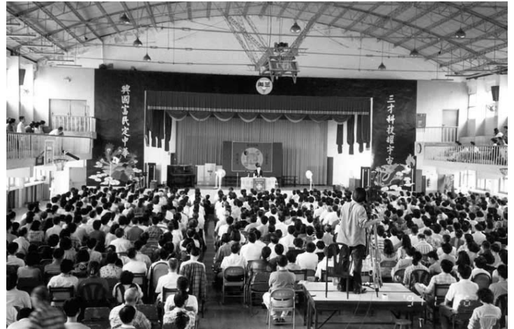
李洪志师父于一九九七年十一月在台北三兴国小讲法

一九九九年四月二十五日，超过万名法轮功学员在北京中南海和平上访，该事件经媒体大幅报导，把法轮功推向了世界舞台。同年七月二十日中共江氏集团展开大规模打压，法轮功学员遭到严重迫害，该事件经台湾媒体披露后，法轮功的知名度迅速传开，由于免费教功，