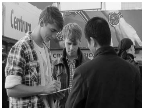
图：波兰各界人士踊跃签名

【明慧网】二零一二年十月十二日至二十三日，波兰法轮功学员在华沙市中心地铁广场揭露中共对法轮功十三年来的残酷迫害，特别是中共活摘器官、并将尸体加工贩卖牟利的滔天罪行，征集签名反迫害。征签台前常常排起长队，所有参与征签的人都共同发出一个声音：呼吁联合国行使职权，尽快开展独立调查，制止中共的反人类邪恶暴行。◇