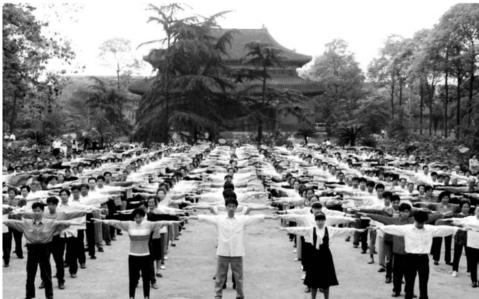
历史图片：1999年迫害发生前四川成都法轮功学员集体炼功

母身边。第二天，我对家人说，我现在的精神状态极差，我不知道自己接下来会怎么样，这次能回来见到你们我很高兴，我一直怕不能回来见你们了。我母亲和我妹妹们修炼法轮大法有半年了，她们告诉我别担心，说我这个病国外先进的医疗治疗不了，国内的中医、一般的气功也解决不了，只有修炼法轮大法，才能真正救了我。我从小受中共邪党无神论的教育，对修炼没有任何认识，但心里却非常肯定地感觉到只有法轮大法能救我。从此我走上了修炼法轮大法的神圣之路。