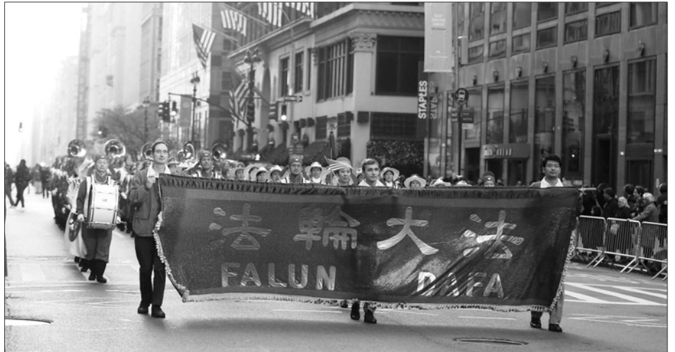
二零一二年纽约老兵节游行中法轮功学员的队伍

到的是我们邀请到的法轮大法游行队伍，他们是退伍军人节游行的老朋友，他们传递着‘真、善、忍’的美好信息，请大家掌声欢迎他们！”