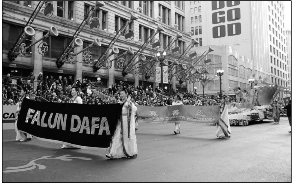
美中法轮大法学会第十年受邀参加麦当劳感恩节游行

“真、善、忍”的横幅紧随其后，大型莲花花车缓缓行驶，身着彩色炼功服的学员演示着法轮功功法，气氛祥和。花车后面的队伍中，学员们手执写有“法轮大法令人身体健康、心灵平和”、“法轮大法好”和“真、善、忍好”等中英文字样的旗帜。解说员一遍遍地向人们介绍着法轮大法的