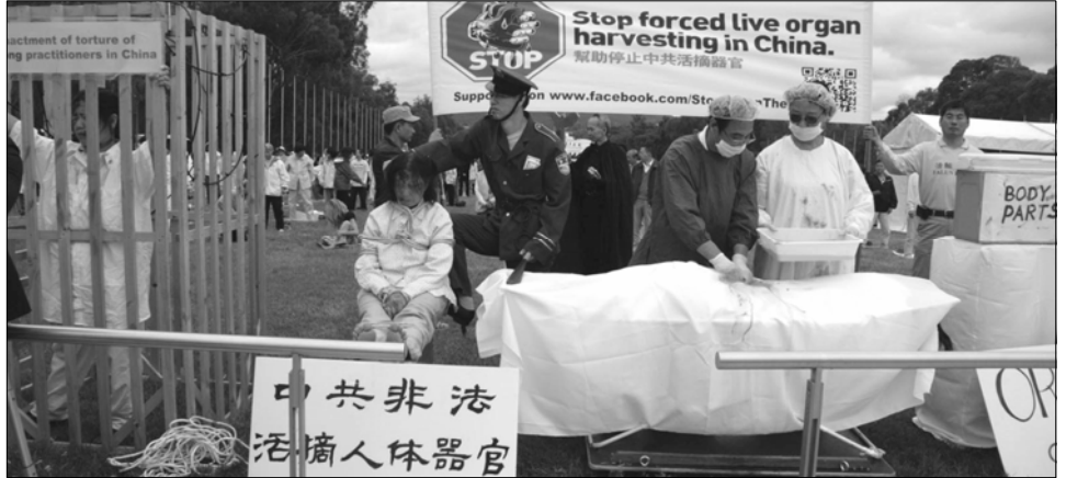
图：国会大厦前模拟演示，揭露中共酷刑迫害法轮功学员并活体摘取器官。

来自美国的智库研究员伊森·葛特曼先生是作家及研究者，也是调查法轮功学员和其他一些政治犯被中共活摘器官的主要独立调查员之一，同时是《失去新中国》一书的作者及《亚洲华尔街日报》等刊物的撰稿人。他与悉尼大学药理学和运动科学教授菲尔特罗内·辛格在研讨会上就中共谋杀法轮功学员，非法摘取和出售他们器官的指控及对指控进行的调查做了详尽的介绍。