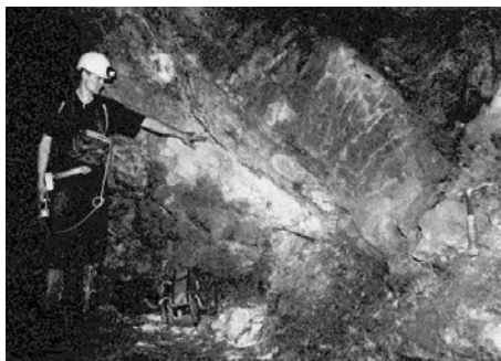
图：美国航天局 2005 年 2 月 20 日公布 20 亿年前的核反应堆图片。

法国政府宣布了这一发现，震惊了世界，并吸引了各国的科学家们来到奥克洛研究，研究成果在 1975 年国际原子能委员会的一个会议上公布：这是一个大型的、天然核反应堆，由六个区域约 500 吨铀矿石构成，输出功率估计为 100 千瓦。核反应堆为二