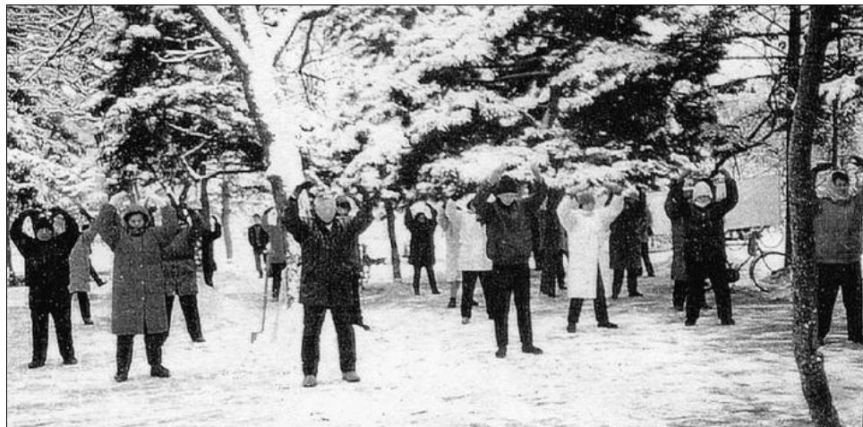
图：一九九六年长春法轮功学员集体炼功