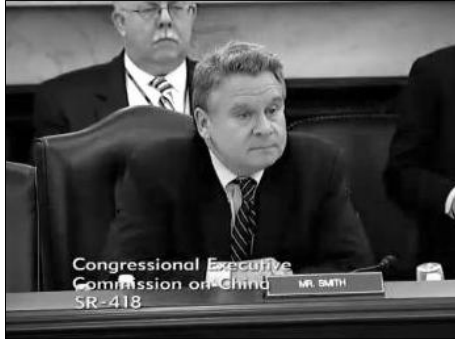
图：美国国会及行政当局中国委员会主席克里斯·史密斯议员

国际非政府人权机构“自由之家”资深研究分析师萨拉·库克女士分析了中共为什么要发动对法轮功的迫害。法轮功修炼人数的不断增加，法轮功“真、善、忍”的原则与中共意识形态的差异，让中共感到威胁，加上中共独裁者江泽民的个人妒嫉，于是在九九年发动了迫害。库克认为，中共对法轮功的迫害与中共几