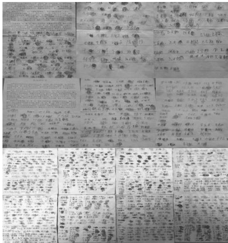
签名图片：青龙满族自治县各乡镇第二批为崔爱军征签 1841 人。

崔家的遭遇，引起青龙县各乡镇民众的同情及愤慨，至 3 月中旬，有 3800 乡亲签名声援崔爱军，其中崔爱军居住的沟口子村，全体村民 156 人都签名、按手印，强烈呼吁警察放