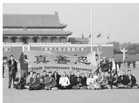
图：2001 年 11 月 20 日，35 名西人法轮功学员在天安门广场打出“真善忍”横幅为法轮功进行和平请愿，数分钟后全部遭到中国警察逮捕。

善”发端，5000 年来，贯穿着“心底无私天地宽”，“先天下之忧而忧”，“留取丹心照汗青”的高贵豁达。有道是，做好人还怕啥呢？不要小看那个大陆官员“真善忍有什么好？”的雷人之语，中国社会这十幾年来的道德堕落，就是从中共迫害法轮功，社会蔑视“真善忍”开始的。