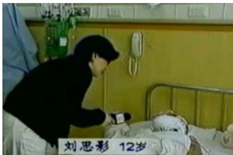
图片说明：中央电视台“天安门自焚案”中的“烧伤病人”，记者不穿卫生服，不戴口罩，大胆采访。