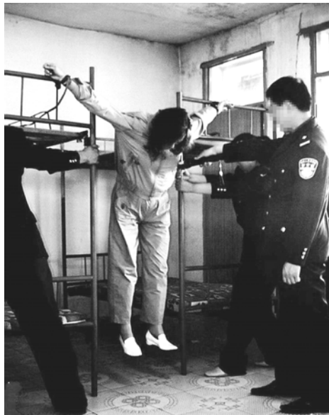
图片说明：酷刑演示“抻刑”

在突破中共严密封锁而在明慧网报道出来的法轮功学员遭迫害案例中，近期非法判重刑案例明显增加。根据明慧网的不完全统计，从 2013 年 1 月 1 日至 4 月 7 日，非法判刑案例 90 例（去年同期非法判刑