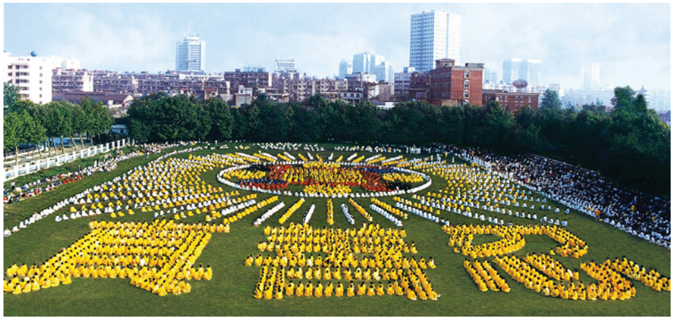
图片说明：李洪志师父在武汉共举办过五期法轮功传授班。法轮功备受武汉人民喜爱。这是 1997 年由 5000 多名武汉法轮功学员集体炼功，列队组字，上部分为法轮图形，下部分为“真善忍”，场面宏大，震撼人心。

那时我们每天早、晚都在炼功点集体炼功、读《转法轮》，越来越多的人走入法轮功修炼。有一次参加集体炼功，从古田路到黄浦路，全是法轮功学员在街道两边炼功。那时法轮