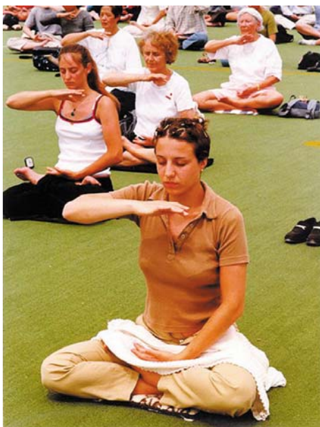
图片说明: 欧洲法轮功学员集体炼功