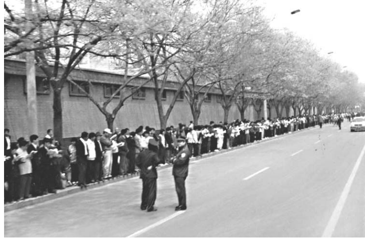
图片说明：秩序井然的“四二五”上访民众

十四年前的四月二十五日，逾万名法轮功学员在面对不公和打压时，采取和平、理智的方式——上访，向政府和民众讲真相并争取基本的信仰权利。从那一天开始，十四年里，伴随着江罗刘周中共集团的全面打压，法轮功学员对信仰的坚守和用讲真相的方式和