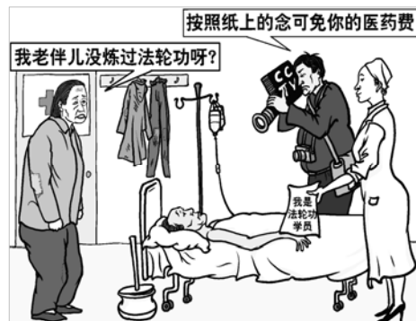
图：收买病人，利用病人的贪利、急切之心，制造伪证来陷害法轮功。

对此，法轮功学员一眼就能看出破绽：因为修炼法轮功是严禁喝酒的，可是中共摆拍的照片中却有酒具，那不明摆着是造假吗？然而中共封锁了所有的信息渠道后，人们无法了解法轮功真相。◇