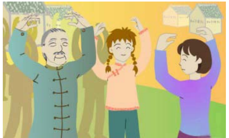
全村 300 人，有 80 多人每天参加集体读书、炼功

1998 年初，法轮大法（法轮功）传到了这个小村庄。全村 300 人，有 80 多人每天参加集体读书、炼功，自觉地不再干偷盗的事了。在这些人的带动下，这里的偷盗风得到了彻底的改变。这一年的冬天，村民们派代表，到广州参加法轮功修炼心得交流会，谈了他们变化的经过。这位农村学员谈到：“以前不知这个理，以为公家的东西不拿白不拿，你不偷他也偷。现在知道‘不失不得，得就得失’的理。宁江镇政府一位干部深有感触地说，你们法轮功真是太好啦，起到了法律起不到的作用，我也要买一本你们的书看看。”