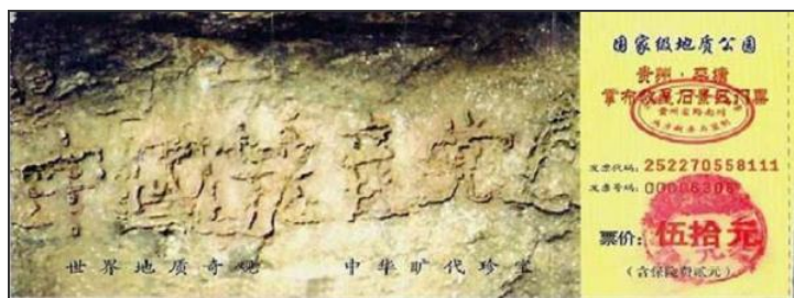
贵州省平塘掌布乡“藏字石”风景区的门票

至活摘器官等，使数以千万计的法轮功学员遭受不同程度的迫害，导致成千上万的善良之家破人亡；使中华大地笼罩在红色恐怖之中，处处腥风血雨。