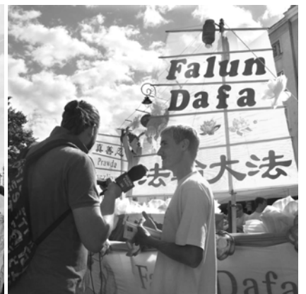
波兰国家媒体采访法轮功学员