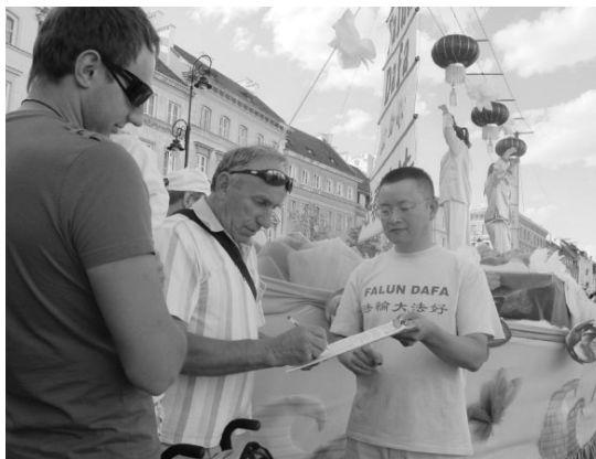
民众签名谴责中共活摘器官

天网恢恢,疏而不漏。江泽民、周永康、罗干、薄熙来等三十多个迫害元凶已在世界数十个国家被法轮功学员以“反人类罪”、“酷刑”或“群体灭绝罪”的万国公罪告上法庭。薄与江氏利用中共国家机器迫害法轮功,其罪恶已与中共捆绑在一起。尽管中共现任当权者出于“保党”仍在掩盖,但在不可阻挡的天象之下,中共邪党正在民众的唾弃声中走向覆灭。在即将到来的天惩和审判面前,每个人的选择决定着自己的未来。◇