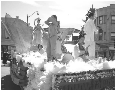
在莲花车上演示法轮功五套功法

如今，法轮大法已弘传世界一百多个国家，受到世界人民的喜爱，因为对人类身心健康做出的杰出贡献，获各国政府褒奖、支持议案、支持信函三千多项。（文/舒静）◇