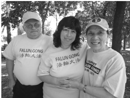
乔治和玛丽娜夫妇与华人法轮功学员