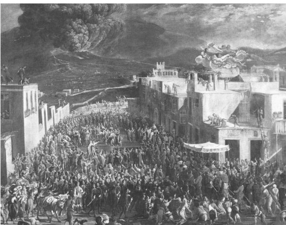
图 1：庞贝古城遗址