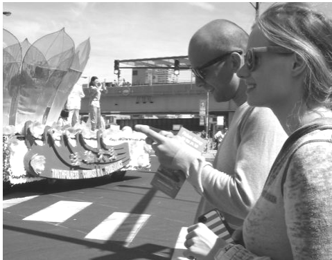
接到真相传单的游客用手机拍照发短信