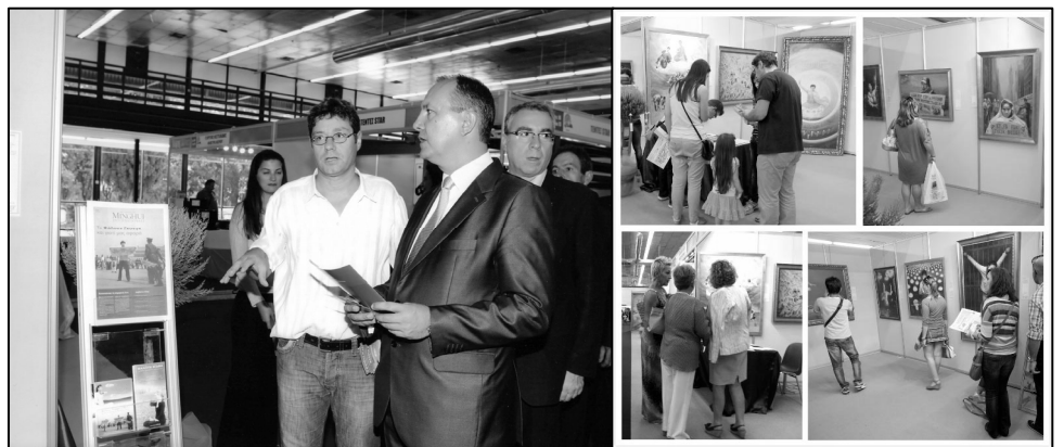
左：希腊北部部长在听法轮功学员讲解；右：观看画展的人们络绎不绝

画展期间，希腊北部部长 Karaoglou Theodoros 先生，议员 Varvitsiotis 先生和议员 Sakorafa 女士，还有欧洲议会议员 Skylakakis 先生等政要都前来参观画展。他们站在“医生活摘法轮功学员器官”那幅油画前，一边凝神看，一遍认真听法轮功学员讲这幅画的背景。当他们听说画面上活摘器官的血腥场面都是根据实际情况画出来的，这样活摘法轮功学员器官的案件在中国大量真实发生过，并且现在还继续发生时，