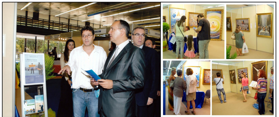
左：希腊北部部长在听法轮功学员讲解；右：观看画展的人们络绎不绝

画展期间，希腊北部部长 Karaoglou Theodoros 先生，议员 Varvitsiotis 先生和议员 Sakorafa 女士，还有欧洲议会议员 Skylakakis 先生等政要都前来参观画展。他们站在“医生活摘法轮功学员器官”那幅油画前，一边凝神看，一遍认真听法轮功学员讲这幅画的背景。当他们听说画面上活摘器官的血腥场面都是根据实际情况画出来的，这样活摘法轮功学员器官的案件在中国大量真实发生过，并且现在还继续发生时，