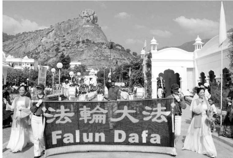
天国乐团在印度阿布山下演奏 右图：主办单位向天国乐团代表颁发奖牌并献上哈达