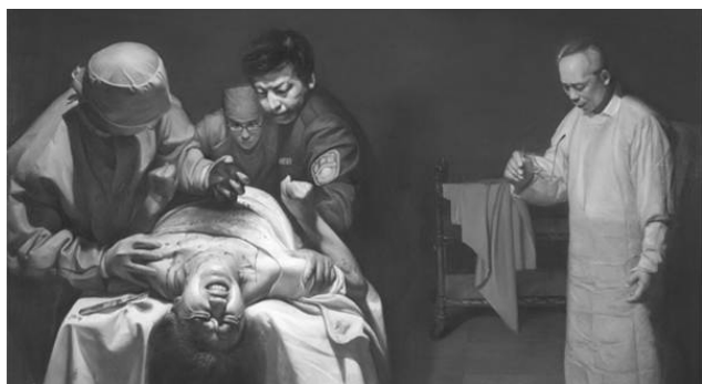
油画《活摘器官的罪恶》

一九八六年的一天，科室领导派我去取一块人体组织，作为实验室切片用。我来到病房大楼一楼的房间，床上躺着一位约二十岁左右的男青年，从裸露的双下肢看，他身体非常健康、结实。我去时，见他的胸腹已被切开，肝、肾等器官已被取走，一位眼科医师正在取他的眼角膜。我向主刀医师要一块食道组织，当医师在他胸部切取时，我突然发现