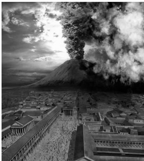
油画：庞贝火山喷发