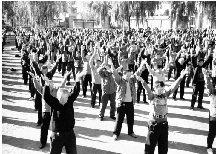
99年迫害前，辽宁凌源市大法弟子集体炼功

三十多年的佛教净土修炼中，大姐陆续帮助过不少人，但从来不允许别人把她的事情跟其他人讲，也坚决不收受任何人的钱财。她曾开玩笑地说：如果当时收钱，可能早就是百万富翁了！这也证明，一个真正修