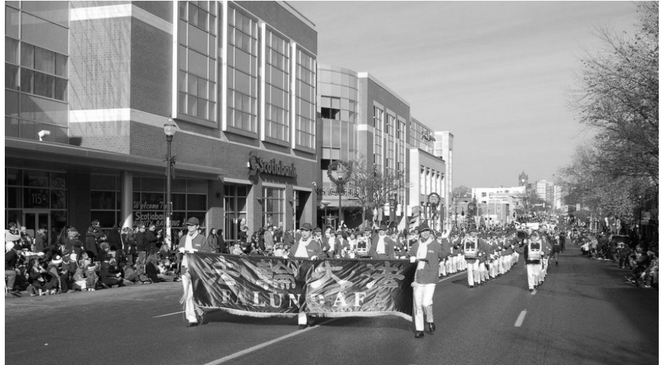
二零一三年十一月十六日，多伦多天国乐团滑铁卢圣诞大游行受欢迎

南京的李先生说：“海外的传媒很自由，法轮功的消息我们都了解，法轮功弘传世界我们都知道。只有中共对他们进行残酷的迫害。但是看看王立军、薄熙来的下场，其实中共也该知道自己的结局了。”