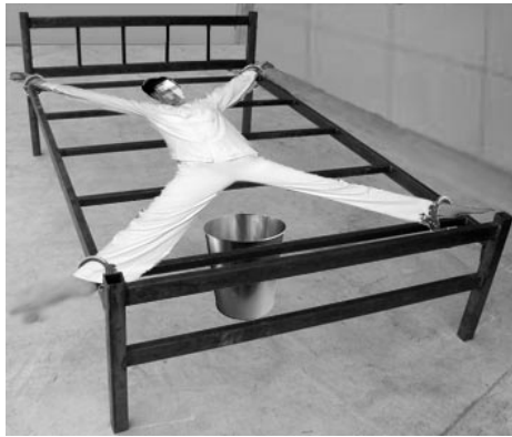
酷刑示意图：死人床

他们都是戴着手铐脚镣进来的。进来后每天 24 小时被大字型地铐在床上，只有吃饭、上厕所暂时把铐子打开，完事立刻铐上。每屋四人，四张床，一个角一张。四名法轮功学员就这样整日被铐在床上。半夜一、二点钟经常听到凄惨的叫声：“警察杀人了！”之后就听到被子捂嘴的声音，