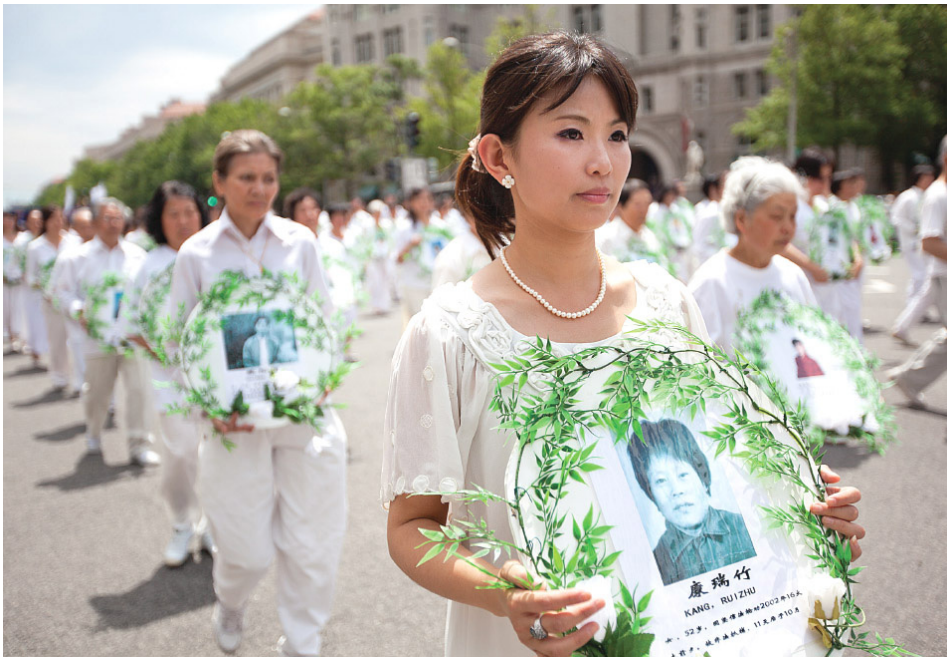
海外反迫害大遊行，紀念被中共迫害致死的法輪功學員。