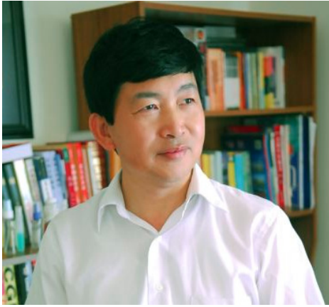
高大維博士，原廣東華南理工大學輕工食品學院院長，博士生導師，獲國家級科研成果獎的年輕教授，現居美國。