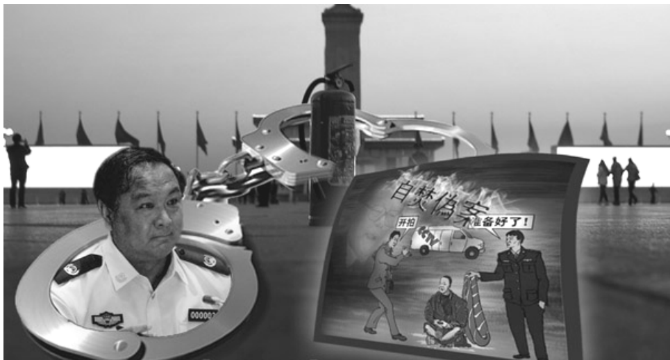
李东生亲自监制了中央电视台“天安门自焚伪案”的谎言在全球传播的整个秘密过程。

2001年1月23日，天安门广场发生自焚事件，中央电视台一反新闻审查的常态，于第一时间并以以前所未有的高调在“焦点访谈”报导，把事