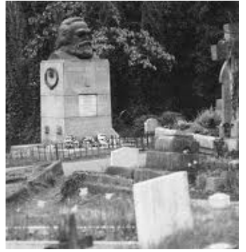
馬克思死後葬身倫敦高門墓地（撒旦教活動中心），其撒旦教徒身分再被關注。

在西方文化中，撒旦通常被稱作「魔鬼撒旦」、「惡魔」。顯然，馬克思承認有上帝的存在，還承認有魔鬼和地獄。馬克思仇恨上帝，是因為被魔鬼撒旦選中，要向上帝復讐。