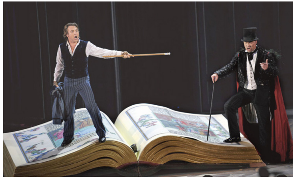
話劇《浮士德》中的惡魔梅斐斯特（右）。自稱「與魔鬼撒旦簽了約」的馬克思，喜歡複述惡魔梅斐斯特的話：「一切存在都應該被毀滅。」