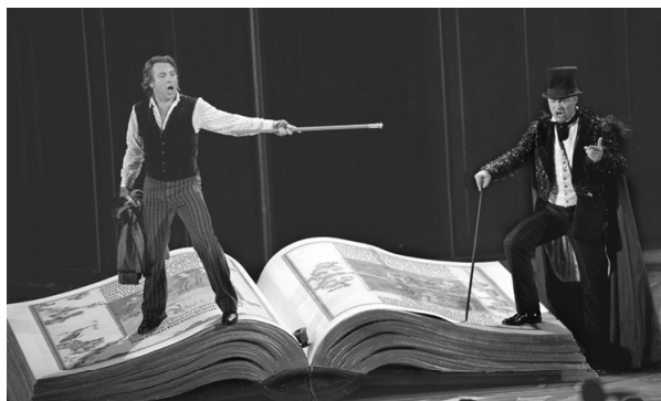
话剧《浮士德》中的恶魔梅斐斯特（右）。自称“与魔鬼撒旦签了约”的马克思，喜欢复述恶魔梅斐斯特的话：“一切存在都应该被毁灭。”