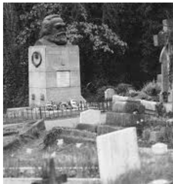
马克思死后葬身伦敦高门墓地（撒旦教活动中心），其撒旦教徒身份再被关注。

在西方文化中，撒旦通常被称作“魔鬼撒旦”、“恶魔”。显然，马克思承认有上帝的存在，还承认有魔鬼和地狱。马克思仇恨上帝，是因为被魔鬼撒旦选中，要向上帝复仇。