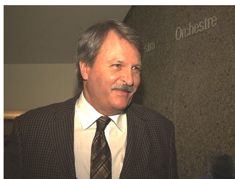
加拿大安省議員傑克·麥克萊倫

些組織到我的辦公室，來影響我的觀點和我對法輪功的支持。他們是非常非常錯誤的。我今後要更有力地為法輪功發聲。我支持法輪功團體和他們