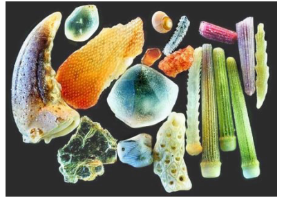
顯微鏡中，250 倍放大率下的沙子。在遠超人眼視覺解析度極限的情況下，這些細小的微粒呈現出精細的結構和絢麗的光彩。