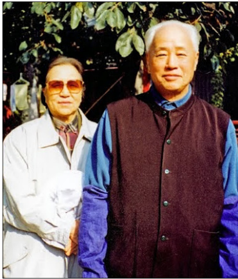
图：晚年赵紫阳、梁伯琪夫妇

他们返回北京后，我也曾去北京富强胡同看望他们。我也向他们身边的工作人员讲述法轮大法的美好。在北京时，我曾经和梁阿姨一起去参加集